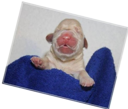
Hündin blau, 12.00 Uhr, 510g