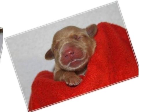
Hündin rot, 11.06 Uhr, 480g